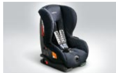
98 Lastenistuin, SUBARU DUO Plus F410EYA002 W