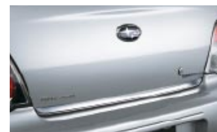
15 Takaluukun koristelista, sedan (kromi) E755EFE100 W