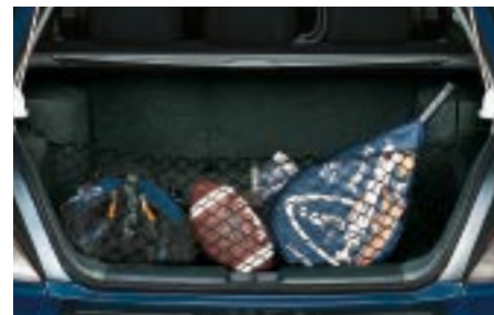
65 Tavaraverkko, taakse F5510SS200 W