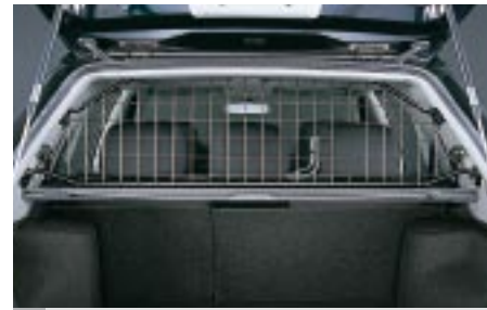
61 Koiraverkko (K/M) F5510SE000 W