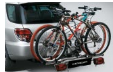
55 Polkupyöräteline, asennetaan vetokoukkuun E361ESA600 W