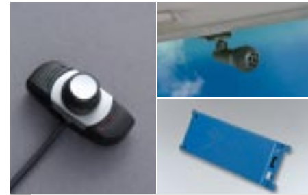
59 Bluetooth hands free SEDEYA6001 E Johdoton, kokonaan äänellä hallittu.