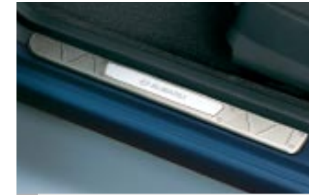
68 Kynnysuoja SUBARU-logolla E1010FE015 W