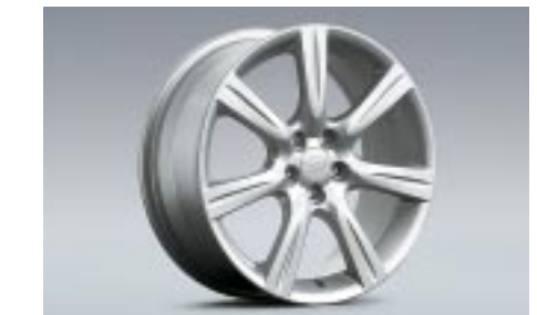
28 Kevytmetallivanne, hopea (17") 28111FE300 W 7"x17" offset 55 Vannekoko: 215/45 R17