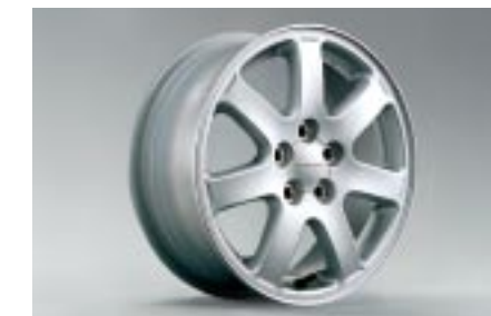
33 Kevytmetallivanne 7-puolainen (15") 28111FE011 W 6"x15" offset 55 Vannekoko: 185/65 R15, 195/60 R15