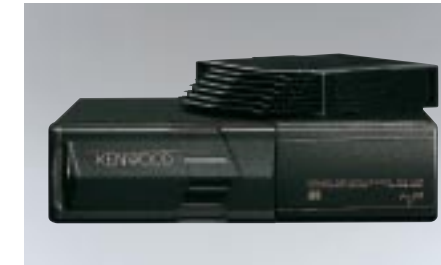
92 CD-vaihtaja H6250AE500 W