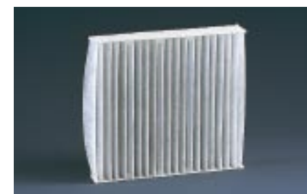
86 Raitisilmasuodatin G3210FE000 W