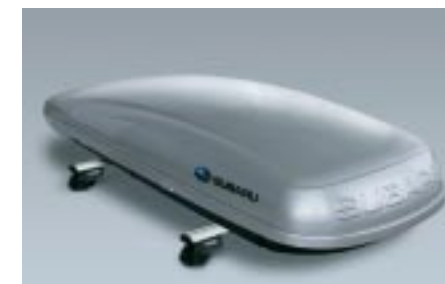
47 Kattoboxi (Pitkä) E361EYA900 W Koko: 2267 x 805 x 355mm. 430 litraa.