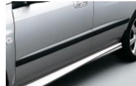
37 Sivusuoja J1010SE010 W