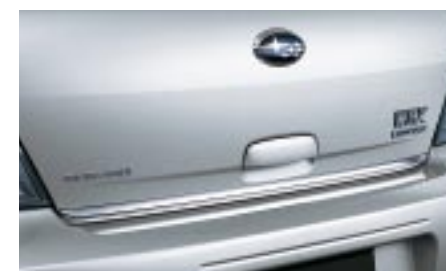
16 Takaluukun koristelista, wagon (kromi) E755EFE000 W