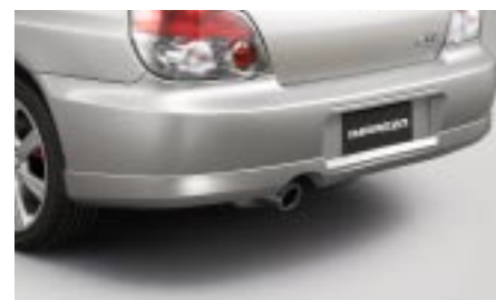
6 Helmaspoileri taakse SECSSE3020 E