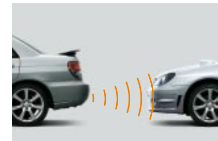
96 Akustinen peruutustutka H481ESA002 W