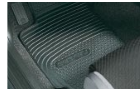
74 Kumimattosarja eteen, taakse J5010SE010/J5010SE020 W