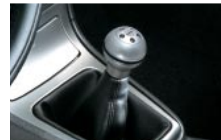
76 Alumiininen vaihdekepinuppi, musta (5MT) C10SEFE000 W