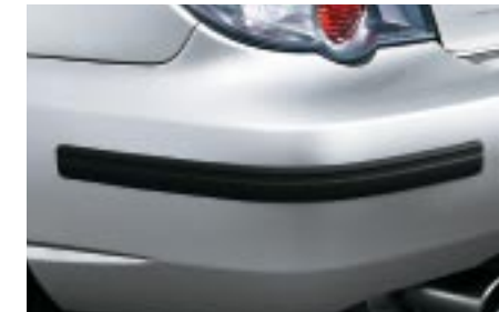
36 Puskurin kulmasuoja J1010SE080 W