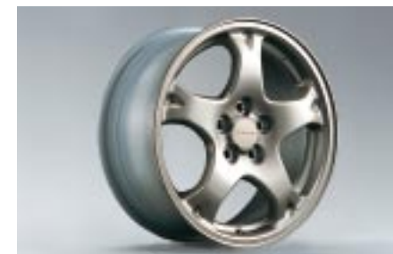
31 Kevytmetallivanne 5-puolainen (16") 28111FE031 W 7"x16" offset 53 Vannekoko: 205/55 R16, 205/50 R16(lumi)