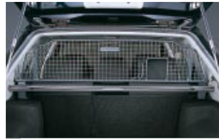
62 Koiraverkko (G/M) F5510SE010 W