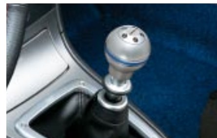
75 Alumiininen vaihdekepinuppi, sininen (6MT) C10SEFE100 W