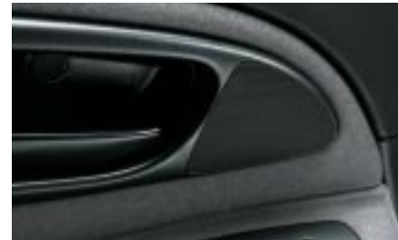
91 Diskanttikaiutin H6300SS700 W