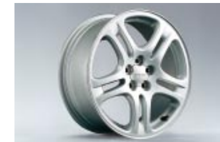
25 Kevytmetallivanne 5-puolainen, hopea (17") 28111AE019 W 7"x17" offset 55 Vannekoko: 215/45 R17