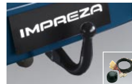
57 Vetokoukku, Johtosarja L10105E100 W