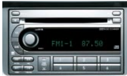
88 2DIN radio 6CD-vaihtajalla H625ESA000 W