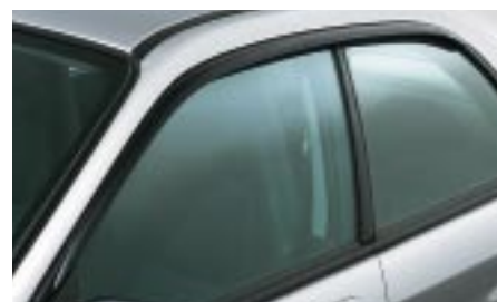
13 Tuuliohjain (Sedan / Wagon) E3610FE000/E3610FE010 W