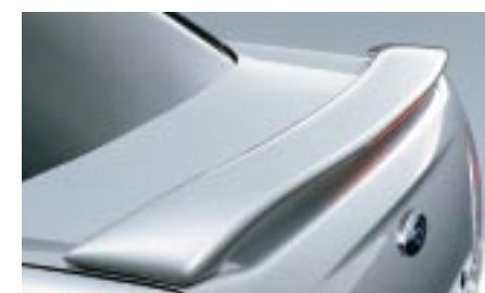
7 Takaspoileri (Pieni/Sedan) E7210SE000 W