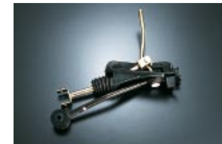
105 STI, sport shift vaihdevälin lyhentäjä (5MT) C1010FA001 W