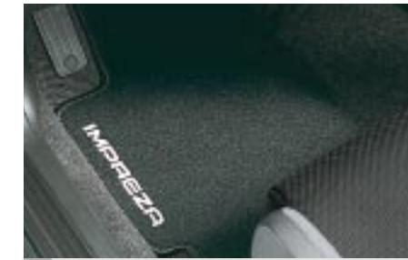
72 Kangasmattosarja J5010SE201 W