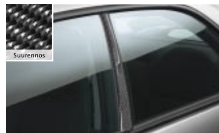
12 Hiilikuitujäljitelmäistä B-pilariin SEBDFE3100 E