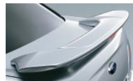
8 Takaspoileri (Iso/Sedan) E7210FE800NN W