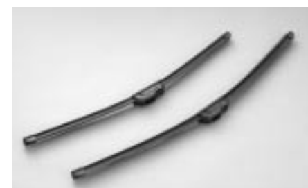
18 Tuulilasinpyyhkiät SEBOFE8000 E