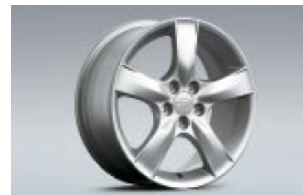
30 Kevytmetallivanne (16") 28111FE310 W 6.5"x16" offset 55 Vannekoko: 205/55 R16, 205/50 R16(lumi)