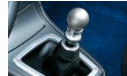
102 STI, titaaninen vaihdekeppinappi (6MT) C1010FE100 W