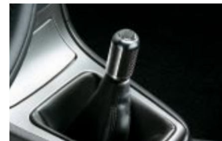
77 Vaihdekepinuppi, hiilikuitu C1010FA140 W