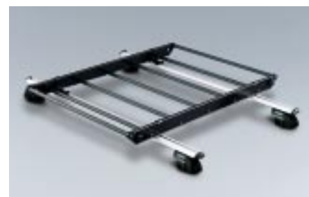
49 Kehikko taakkatelineeseen E361EAG700 W