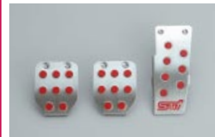
106 STI, Poljin sarja (MT) C8110SA005 W