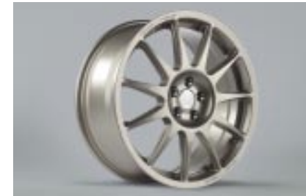
19 Kevytmetallivanne, hopea (18") SESLSE4000 E 8"x18" offset 48 Vannekoko: 215/40 R18, 225/35 R18, 225/40 R18