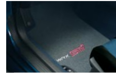
70 Kangasmattosarja WRX STI J5010SE401 W