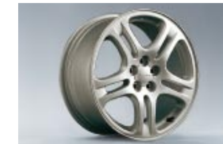
27 Kevytmetallivanne 5-puolainen, harmaa (17") 28111AE144 W 7"x17" offset 55 Vannekoko: 215/45 R17