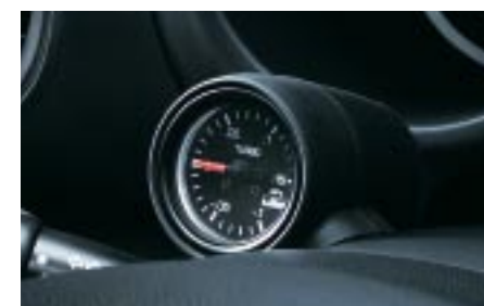
87 Ahtopainemittari H5010FE000 W Ei sovi yhteen sporttimittariston kanssa.