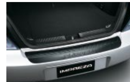
43 Kynnysuojalista takaluukkuun, muovia E7710SE000 W