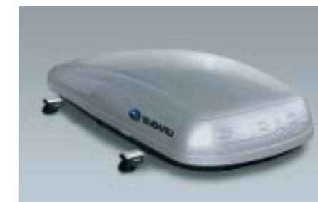
48 Kattoboxi (Lyhyt) E361EYA801 W Koko: 1792 x 797 x 355mm. 380 litraa.