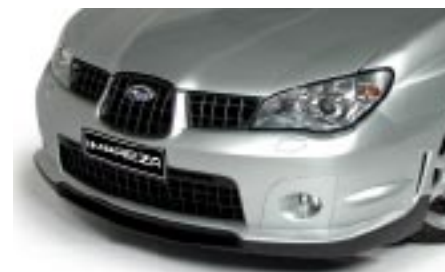
1 Etuspoileri SECSSE3140 E