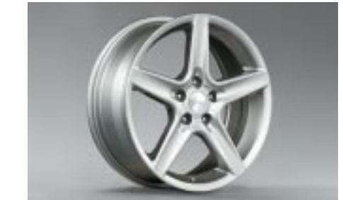
23 Kevytmetallivanne, hopea (17") SESLAG4000 E 7"x17" offset 55 Vannekoko: 215/45 R17