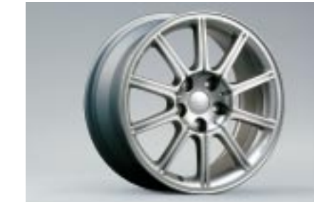
22 Kevytmetallivanne 17" kiillotettu 28111FE370 W 8"x17" offset 53 PCD 114,3 Vannekoko 225/45R17