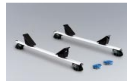
50 Kajakkiteline E361EAG600 W Yhdelle Kajakille.