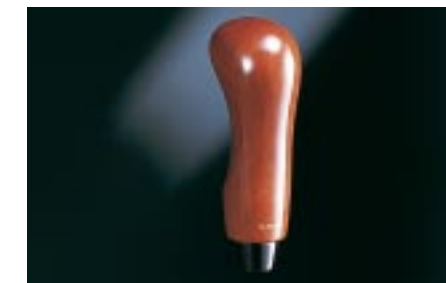
79 Puinen vaihdekepinuppi (AT) C1010AE000 W