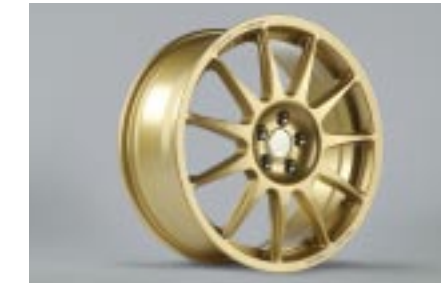
20 Kevytmetallivanne, kultainen (18") SESLSE4010/SESLFE4000 E 8"x18" offset 48 Vannekoko: 215/40 R18, 225/35 R18, 225/40 R18