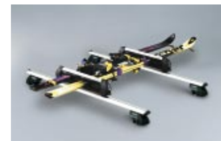
52 Suksipidike, 4 paria (tai 2 lumilautaa) E361EAG500 W