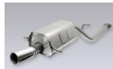
17 Äänenvaimennin (sportti) SEJMSE5001 E