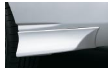
41 Sivuspoileri, pieni/taakse (Wagon) J1010FE244 W