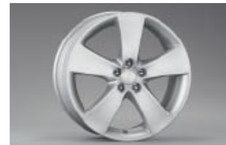
24 Kevytmetallivanne (17") SECWFE4100 E 7"x17" offset 55 Vannekoko: 215/45 R17