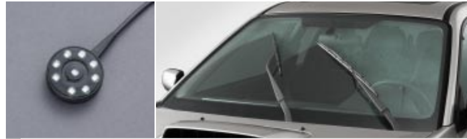
58 Sadesensori SEWAYA8000 E Aktivoi tuulilasin pyyhkiät automaattisesti.