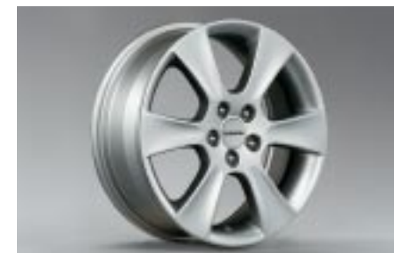
32 Kevytmetallivanne (16") SECWFE4000 E 6.5"x16" offset 55 Vannekoko: 205/55 R16, 205/50 R16(lumi)