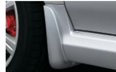
38 Roiskeläppä, eteen (Sedan / Wagon) J1010FE381/J1010FE361 W