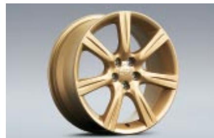
29 Kevytmetallivanne, kultainen (17") 28111FE330 W 7"x17" offset 55 Vannekoko: 215/45 R17