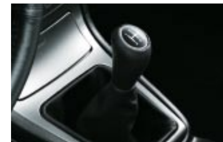
78 Vaihdekepinuppi, nahkaa (MT) 35022AG020 W