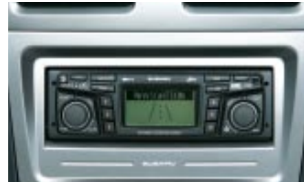
89 Navigaatoriradio / Paneelisarja H001ESA010/H0010FE000 W