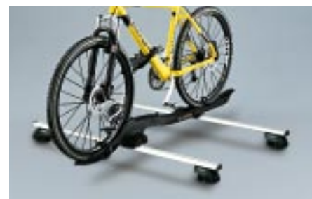
54 Polkupyöräteline (Barracuda) E361ESA501 W