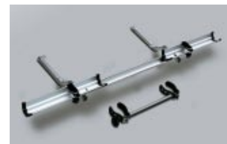
56 Lisäteline E361ESA600:LLE E361EAG800 W