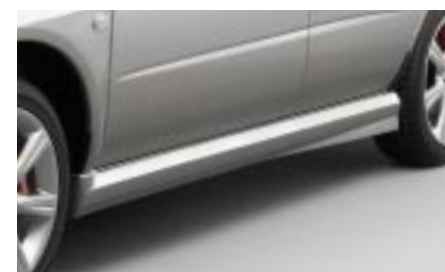
5 Helmaspoileri SECSSE3030 E