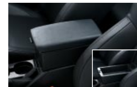
84 Keskikyynnärojan korotus J2010FE050 W