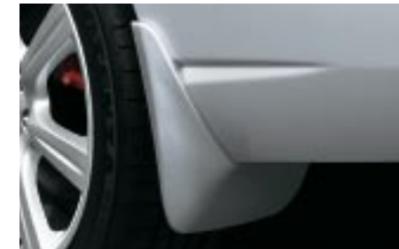
39 Roiskeläppä, taakse (Sedan / Wagon) J1010FE274/J1010FE264 W