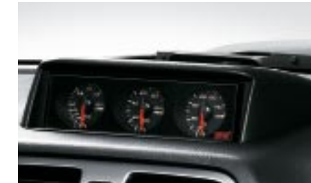
101 STI, sporttimittaristo (L.H.D.) H5010FE500 W

FHI:n sekä STI:n kehittämä "total turning"-konsepti korostaa alkuperäisen auton ominaisuuksia ja suorituskykyä.