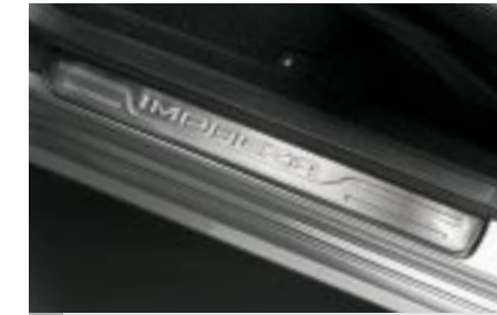
69 Kynnysuoja Impreza-logolla E1010FE005 W