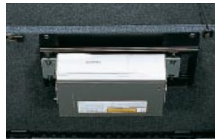
94 AV-teline, CD-vaihtajalle (Wagon) H6210FE900 W Telinettä tarvitaan CD:n tai navigaattorin asennukseen.