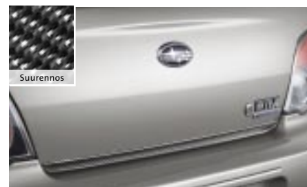
14 Takaluukun koristelista, sedan (hiilikuitu) SEBDFE3000 E