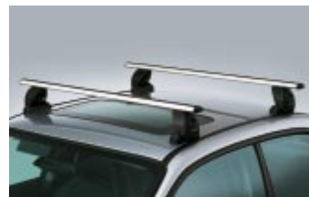
44 Taakkateline, alumiininen E361EFE200 W