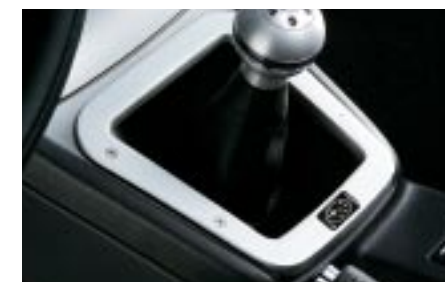
83 Alumiininen vaihdekepinkehys (MT) C10SEFE501 W