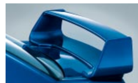
9 Takaspoileri (STI/Sedan) E7210FE000## W