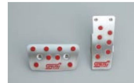
107 STI, Poljin sarja (AT) C8110SA015 W