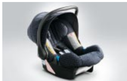
97 Lastenistuin, SUBARU BABY Safe Plus F410EYA102 W