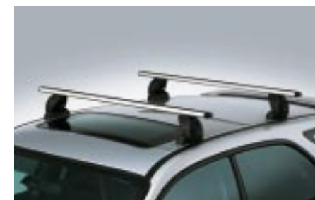
45 Taakkateline ilman kattokaidetta, alumiininen (wagon) E361EFE100 W