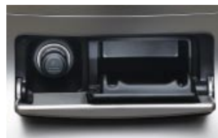
85 Smoker's kit H6010SA000 W