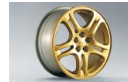
26 Kevytmetallivanne 5-puolainen, kultainen (17") 28111FE021 W 7"x17" offset 55 Vannekoko: 215/45 R17