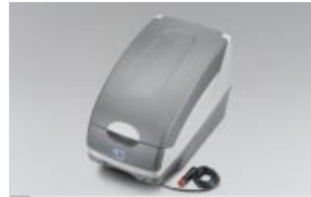
60 Matkajäkäaoppi SEWAYA1000 E