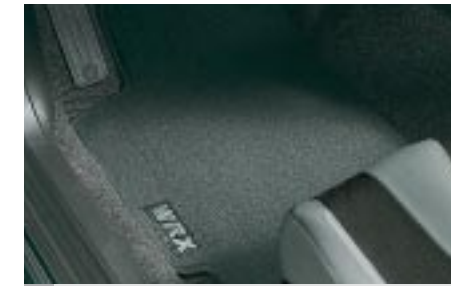
71 Kangasmattosarja WRX J5010SE301 W