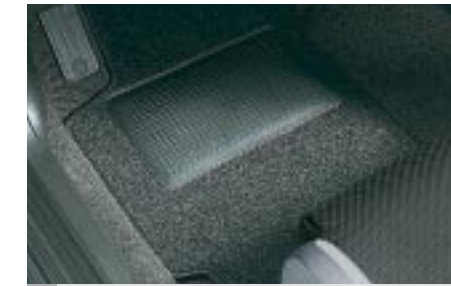
73 Kangasmattosarja Standard J5010SE101 W