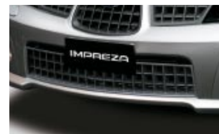
3 Alaetumaski SECSSE3150 E