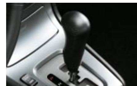
81 Vaihdekepinuppi, nahkaa (AT) 35126FE080 W