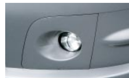
4 Sumuvalo & Sumuvalon reunusteet H4510FE100/H4518FE100## W