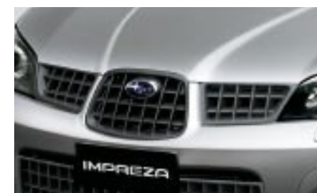
2 Etumaski SECSSE3100 E