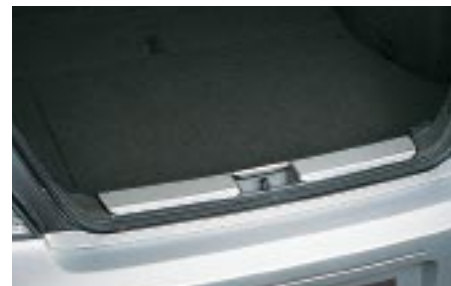
66 Tavaratilan kynnysuoja E1010FE000 W