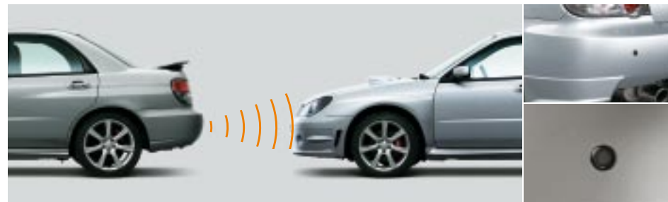
95 Ultrasonic Parking aid (Etu, Taka) SEWAYA2100, SEWAYA2000 E Sensoriohjattu.