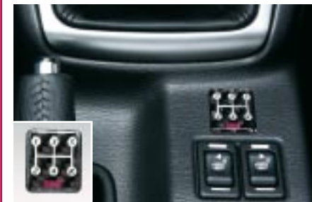
103 STI, vaihdekaaviomerkki (5MT) C1010SA005 W