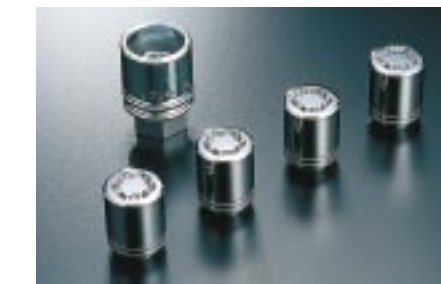
35 Lukkomutterisarja B327EYA000 W Lukkomutterisarja.