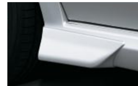
40 Sivuspoileri, pieni/eteen (Wagon) J1010FE351 W