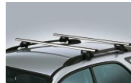
46 Taakkateline kattokaitteeseen, alumiininen (wagon) E361EFE000 W