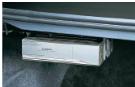
93 AV-teline, CD-vaihtajalle (Sedan) H6210FE902 W Telinettä tarvitaan CD:n tai navigaattorin asennukseen.