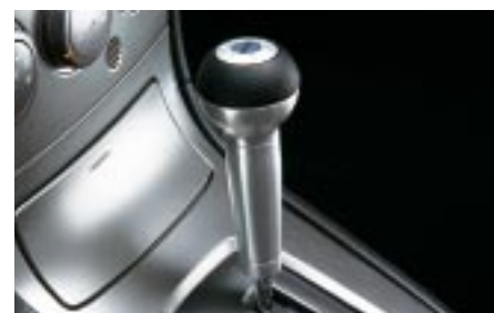
80 Alumiininen vaihdekepinuppi (AT) C101ESA001 W