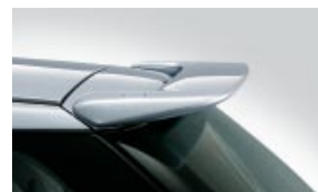
10 Kattospoileri E7210FE820TG W