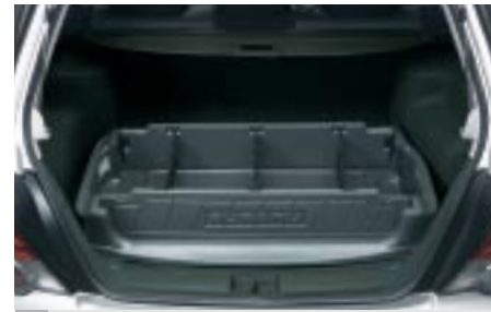
64 Tavaratilan matto, syvä J5010SS200 W