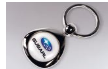
100 SUBARU Pisaranmuotoinen avaimenperä PR-KEYCH-000001 N Subaru avaimenperä.