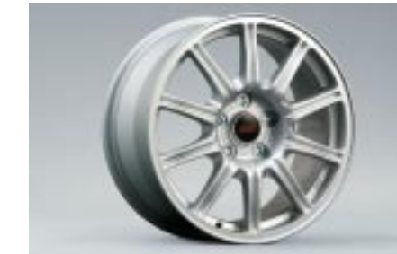
21 Kevytmetallivanne, hopea (17") 28111FE271 W 8"x17" offset 53 PCD 114,3 Vannekoko 225/45R17