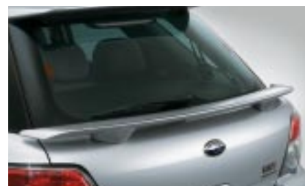
11 Spoileri, taakse E7210FE200## W