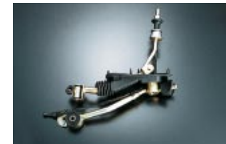
104 STI, sport shift vaihdevälin lyhentäjä (6MT) C1010FE003 W