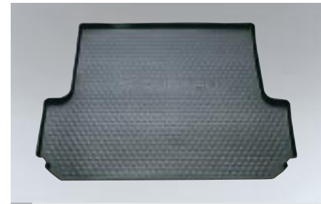
63 Tavaratilan matto (Sedan, Wagon) J5110SE100, J5110SE000 W