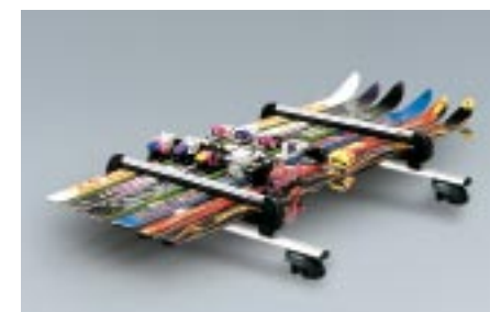
51 Suksipidike, 6 paria (tai 4 lumilautaa) E361EAG550 W