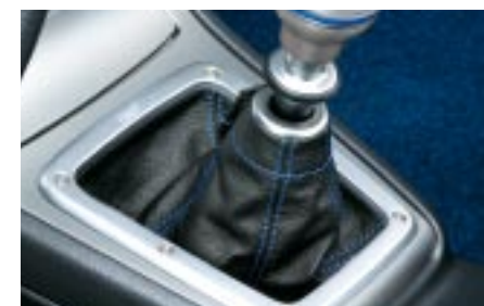
82 Vaihdekepin suojapussi, sininen C10SEFE200 W