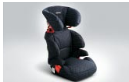
99 Lastenistuin, SUBARU KID Plus F410EYA212 W