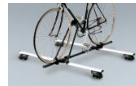
53 Polkupyöräteline (Basic) E361ESA701 W