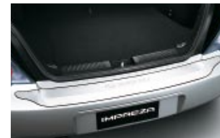
42 Kynnysuojalista takaluukkuun, metallinen E7710FE005 W