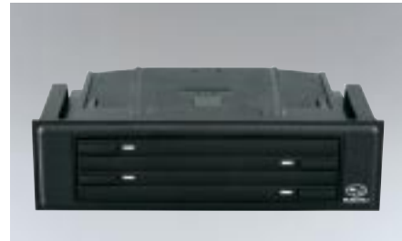
90 CD-kotelo H625ESA201 W