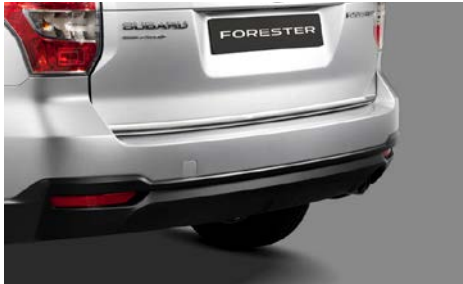
11 Takaluukun koristelista E755ESG000 Kromi.