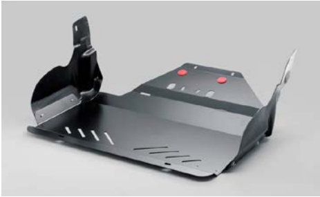
32 Moottorin suojapanssari (benssiini/diesel, ei XT)