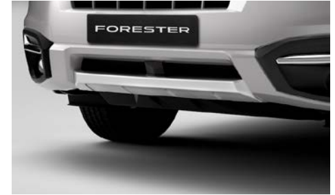
35 Etupuskurin helmasuoja E555ESG001

Teräs. Asennussarja E515ESG510 tarvitaan.