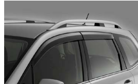
7 Tuuliohjain ovi F0010SG700