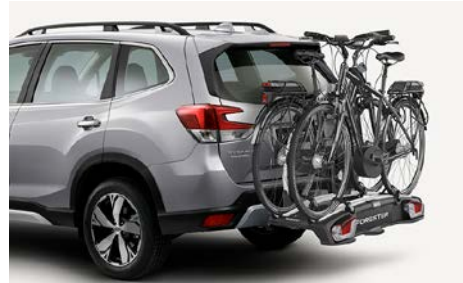
65 Polkupyöräteline (E-pyörä) SETHYA7000