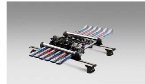
60 Suksipidikkeet kattotelineisiin (max 6 paria)

Maksimissaan 4 suksisarjaa tai 2 lautaa. Kiinnitys kattotelineeseen.