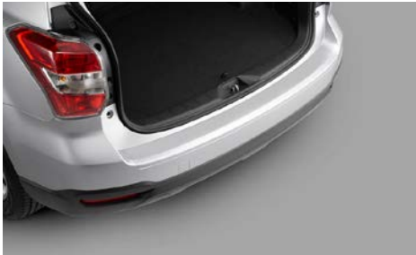
46 Takapuskurin suojakalvo E775ESG100