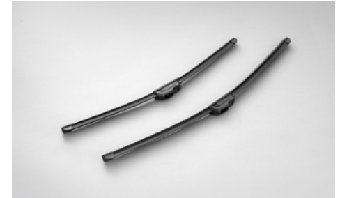
8 Aeroblade-pyyhkijänsulat SEBOSG8000 Pyyhkijänsulat eivät jäädy, joten ne soveltuvat hyvin talvikäyttöön. 2 kpl. Ei Eyesight varustetuihin malleihin.