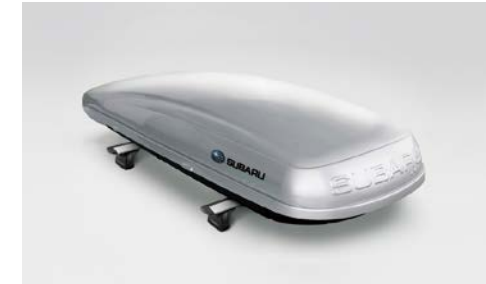
56 Suksiboksi pitkä

Matalaprofiilinen alumiini teline. Saatavana myös mustana, PB938054B.