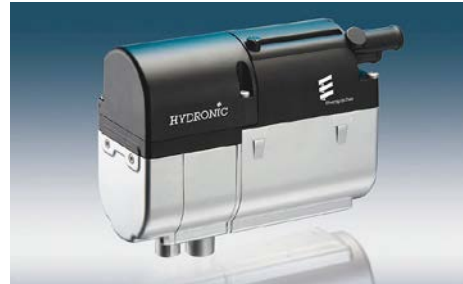
104 Eberspächer (bensiinimoottorille) 29 2481 10 4001

4,3 kW. Lisää ohjain: kaukosäädin tai ajastin. Up until MY18 for all models.