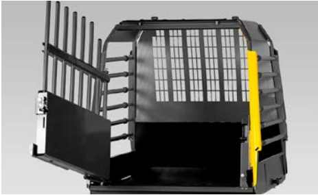
49 MIM Variocage Kuljetushäkki (yhdelta koiralle) XL