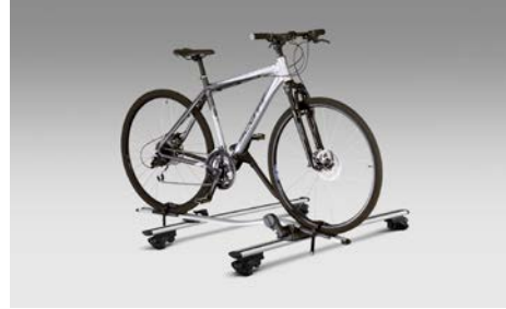
62 Polkupyöräteline, Premium SETHYA7100

Yhdelle polkupyörälle, kiinnitty erikseen hankittavaan kattotelineeseen.