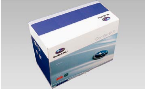
99 Defa mukavuuspaketti 470207

Lämmityssarja verkkovirralla sisältää 1850w lämmittimen, lohkolämmittimen kytkentäsarjan ja verkkokaapelin.