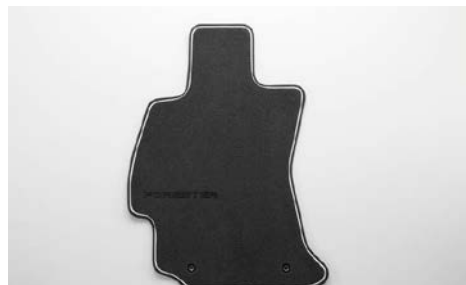
82 Tekstiilimattosarja premium. J505ESG200 Eteen ja taakse. Musta.