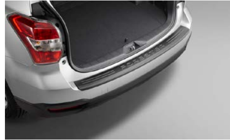
45 Takapuskurin suojalista E775ESG000