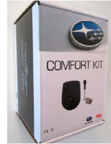
101 Calix mukavuuspaketti CX1620826

DEFA sähköinen moottorin lämmitin. Pakkaus sisältää sisätilan lämmittimen.