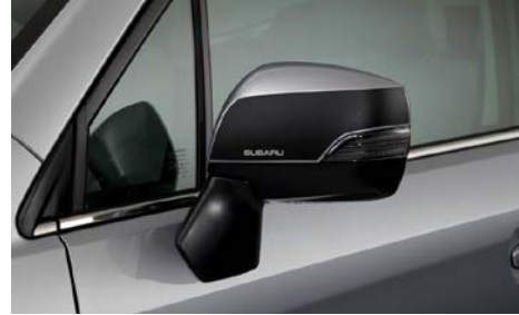
2 Peilinkalvo, musta SEBDFJ3000 Musta. Mallivuodet MY13-