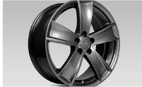
25 Alumiinivanne 17"

17x7JJ offset 48. Hyvä talvivanne. Vanne saatavilla vain talvirengaspakettina.