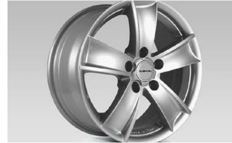
26 Alumiinivanne 17"