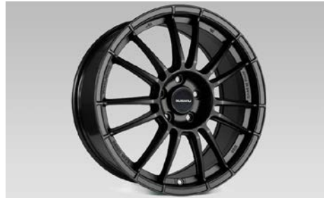
21 Alumiinivanne 19"

17x7JJ offset 48. Keski- kuppi tilattava erikseen SECWYA4000.