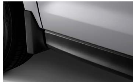
41 Roiskeläpät eteen

Tehokkaasti vaimentavat, kumiset kulmasuojat.