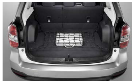
76 Tavaraverkko tavaratilan lattialle F5510SC000