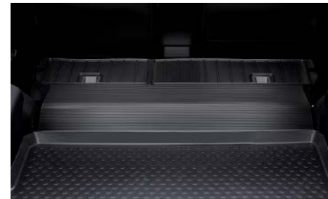
71 Takaselkänojan suoja J515ESG200

Suojaa takaselkänojaa likaantumiselta. *Eryyisesti käytettäessä yhdessä tavaratilan suojamaton kanssa. Tarkista saatavuus jälleennyjältäsi.