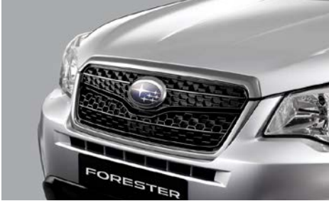
1 Etusäleikkö J1010SG100 Verkkomalli.