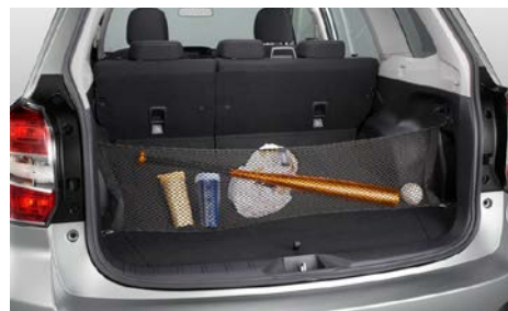
73 Tavaraverkko tavaratilaan F551SSG000