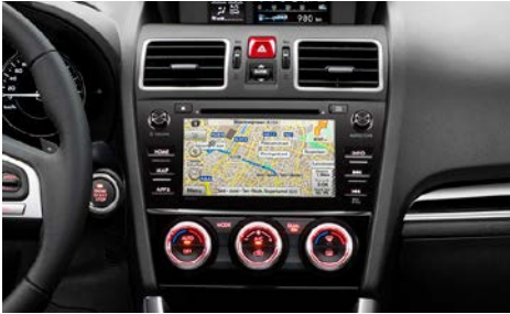
90 OE-Navigation Forester MY18 86471SG480KIT

Vain MY18 malleihin joissa alkuperäisenä DAB radio.