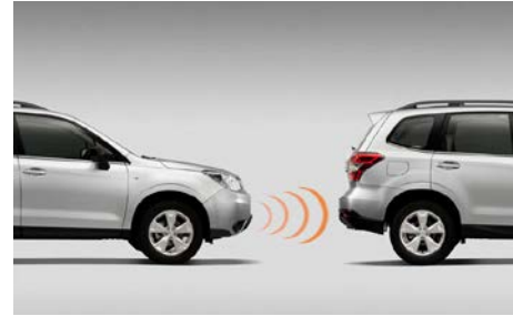
95 Pysäköintitutka eteen H485ESG100

Ääniavusteinen, 4 puskuriin asennettua sensoria. Ei sovi XT. Mallivuodet MY16-18