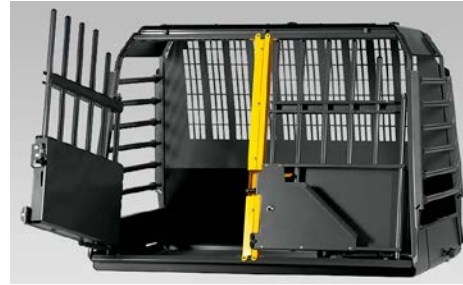
50 MIM Variocage Kuljetushäkki (kahdelta koiralle) XL

Pituus 810-1030 mm, Leveys 700 mm, Korkeus 715 mm