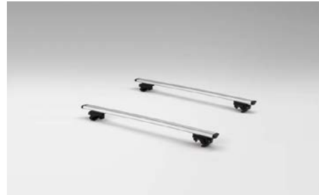
54 Taakkateline (kattokiskoilla)