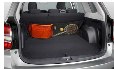
74 Tavaraverkko takapenkin taakse F551SSG020