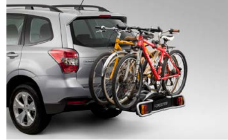
63 Polkupyöräteline E365EFJ400

Asennus kattotelineisiin jotka hankittava erikseen.