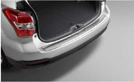
44 Takapuskurin suojalista E7710SG000