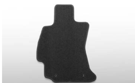
83 Tekstiilimattosarja standard J505ESG100 Eteen ja taakse. Musta.