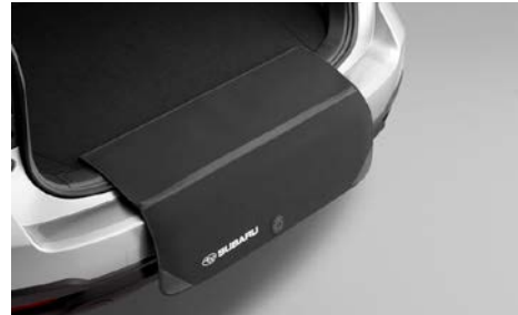
47 Takaluukun lastaussuoja, taitettava E101EAJ500

Suojaa takapuskuria naarmuilta autoa lastatessa.