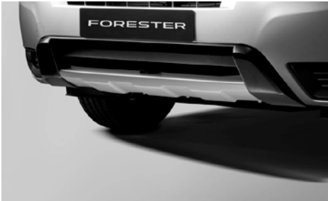
36 Etupuskurin helmasuoja