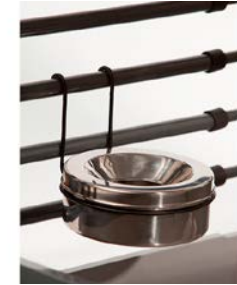
52 Juoma-astia MIM-kuljetushäkkiin