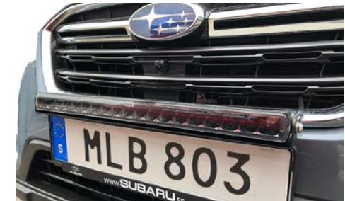
17 Led-lisävalopaneeli 20" BUVLY20EMKITFIN Täydellinen paketti, jossa on Led-valopaneeli, kilpipohja ja sähkösarja. 8100 lumenia, 90W, E-merkitty, 1 lux @ 448m, ref 40. (Voidaan ostaa ilman kilpipohjaa ja sähkösarjaa. Led-valopaneelin tuotenumero BUVLY20EM ja sähkökaapeleilla on tuotenumero BUVIKRELA)