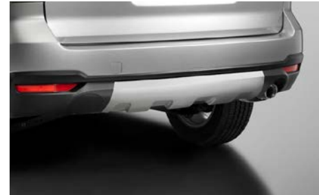
38 Alempi takasuoja