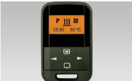
107 Easystart R+ 22 1000 34 1700

Easystart R kaukosäädinohjain Eberspächer.