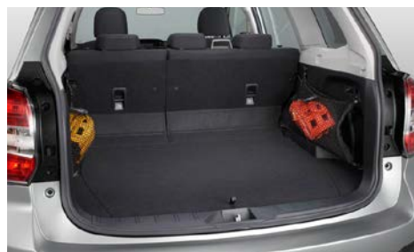
75 Tavaraverkko tavaratilan sivulle F551SSG010