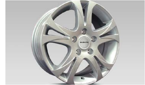
27 Alumiinivanne 16"