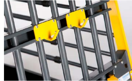
51 Hihnakoukku (2 kpl)

Pituus 810-1030 mm, Leveys 990 mm, Korkeus 715 mm