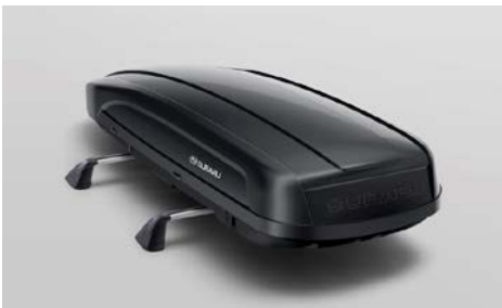
57 Uusi Suksiboksi, "SUBARU"

430 litrainen pitkä (2267x805x355mm). Kiinnitys kattotelineeseen. Mallivuodet MY14-