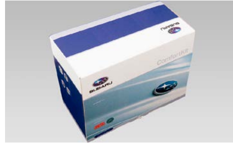
100 Defa mukavuuspaketti (dieselmoottorille) 470292

Lämmityssarja verkkovirralla sisältää 1850w lämmittimen, lohkolämmittimen kytkentäsarjan ja verkkokaapelin.