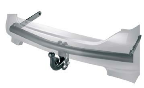
67 Vetokoukku, kiinteä MX105ESG100

Tarvitaan lisäksi 13-napainen sähkösarja MX105EAL100.