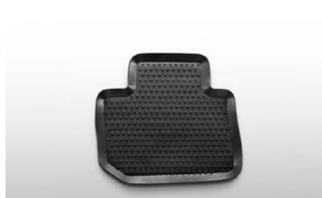
85 Kumimattosarja taakse J505ESG020