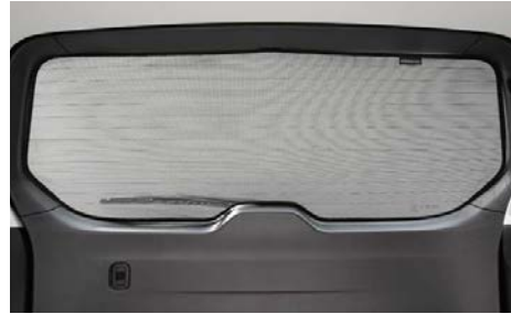
78 Aurinkosuoja takaoven ikkunaan F505ESG000