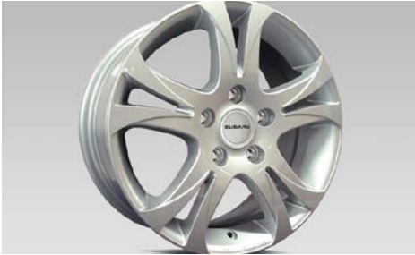
24 Alumiinivanne 17"