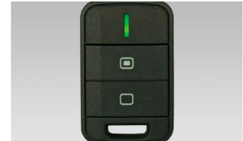
106 Easystart R 22 1000 34 2300

Easystart ajastinkello Eberspächer lämmitinmelle.