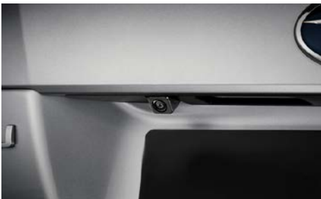
93 Pioneer peruutuskamera S560372B

6.1" korkearesoluutioinen monitoimikosketusnäyttö. Opastusnäyttö ja ääniopastus 17 kielellä. Uusi Android-käyttöliittymä, jossa myös älypuhelimien näytön peilaus. TMC-liikenneinfo sekä esiladatut kartat 45 maasta. DVD, CD, RDS-radio, Aux-liitäntä, USB ja SD-kortinlukija. Peruutuskameraliitäntä. XT vaativat erillistä sovitinta: S560379. Sopii Forester (Vain vuosimalleihin 2014 asti)