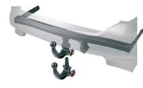
66 Vetokoukku irrotettava MX105ESG000

Tarvitaan lisäksi 13-napainen sähkösarja MX105EAL100.