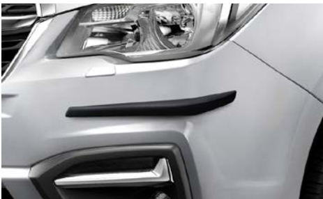
40 Puskurin kulmasuoja