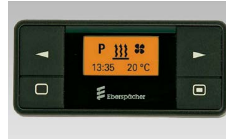
105 Easystart Timer 22 1000 34 1500

4,3 kW. Valitse ohjain: kaukosäädin tai ajastin.