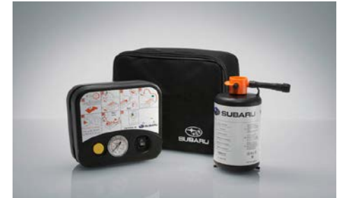
31 Renkaan paikkaussarja

Subaruusi suunnitellut varkaudenestolaitteet vanteisiin.