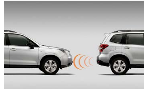
97 Pysäköintitutka takana H485ESG000

Ääniavusteinen, 4 puskuriin asennettua sensoria. Sopii XT