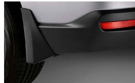
42 Roiskeläpät taakse