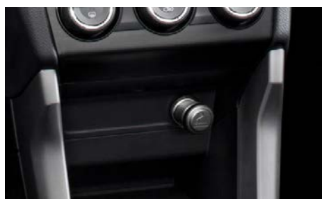
86 Savukkeensytytinsarja H6710SG000