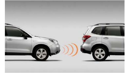
96 Pysäköintitutka eteen H485ESG200

Ääniavusteinen, 4 puskuriin asennettua sensoria. Ei sovi XT. Mallivuodet MY16-18