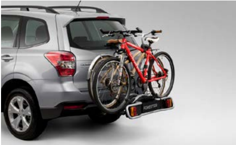
64 Polkupyöräteline E365EFJ400