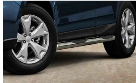
6 Sivutangot STR1370PR02 Tehty käsin kiillotetusta ruostumattomasta teräksestä. Mallivuodet MY13-18.