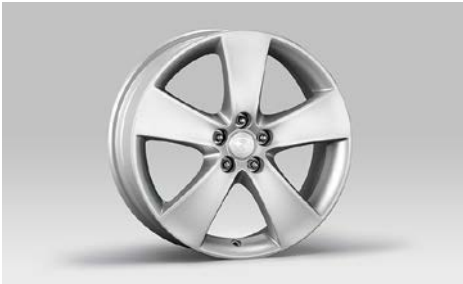
20 Alumiinivanne 17"

17x7JJ offset 48. Keski- kuppi tilattava erikseen 28821SA030.