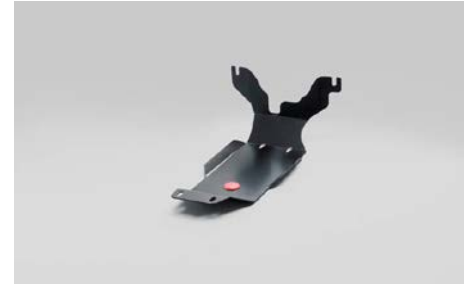
34 Tasauspyörästäön suojapanssari E515ESG500

Moottorin suojapanssari (benssiini/diesel, ei XT). Alumiini. Asennussarja E515ESG010 ja sivupaneelit E515ESG020 tarvitaan.