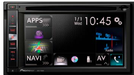
92 Pioneer audionavigaattori S560365-XV12

Esiinkäntävä korkearesoluutioinen monitoimikosketusnäyttö. Opastusnäyttö ja ääniopastus 17 kielellä. DAB-vastaanotin digitaalisia radiolähetyksiä varten. Uusi Android-käyttöliittymä, jossa myös älypuhelimien näytön peilaus. TMC-liikenneinfo sekä esiladatut kartat 45 maasta. DVD, CD, RDS-radio, Aux-liitäntä, USB, HDMI ja SD-kortinlukija. Peruutuskameraliitäntä. XT vaativat erillistä sovitinta: S560379. Sopii Impreza-, WRX STI-, Forester- ja XV-malleihin (Vain vuosimalleihin 2014 asti)