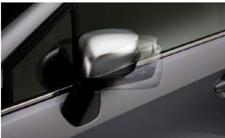
9 Automaattinen peilintaitto SEECAL3100 Peilit taittuvat korinmyötäisiksi lukittaessa ja aukeavat, kun syytysvirta kytketään. Can only be mounted on cars with electrical folding door mirrors. For Forester MY16-,