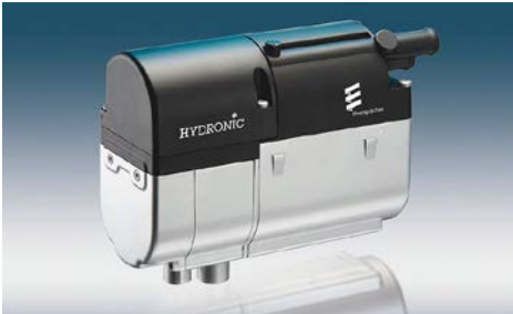
103 Eberspächer (dieselmoottorille) 29 2471 20 4045

4,3 kW. Lisää ohjain: kaukosäädin tai ajastin. Up until MY18 for all models.