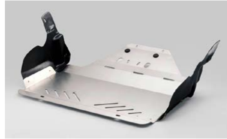
33 Moottorin suojapanssari (benssiini/diesel, ei XT)

Teräs. Asennussarja E515ESG010 ja sivupaneelit E515ESG020 tarvitaan.