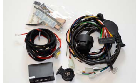
68 Vetokoukun johtosarja Subaru 13 napainen

Tarvitaan lisäksi 13-napainen sähkösarja MX105EAL100.