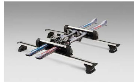
59 Suksipidikkeet kattotelineisiin (max 4 paria)

Yhdelle kajakille. Kiinnitys kattotelineeseen.