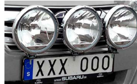
13 Ei saatavilla.