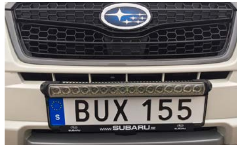
15 Ei saatavilla.