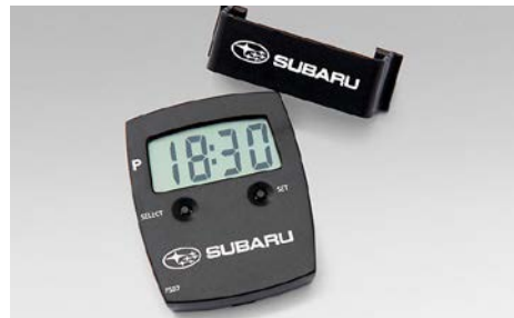
81 Automaattinen parkkikiekko S660400