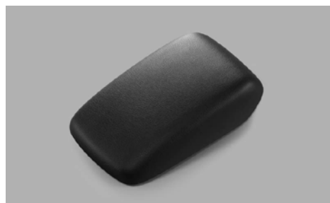
88 Käsinoja keskikonsoliin 92114SG050JC Musta liukuva