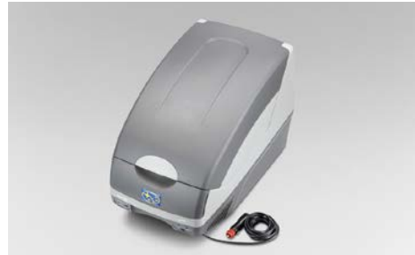
80 Matkajääkaappi SEWAYA1000 Jäähdytys- tai lämmitystoiminto, 12V (Tupakansytytinkiitin), Tilavuus 15 litraa, Kiinnitetään turvavyöhön.