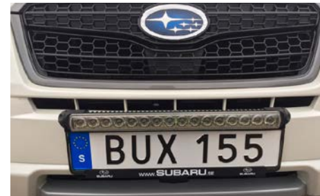
16 Ei saatavilla.