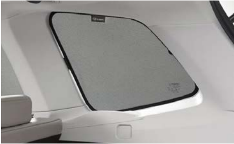
77 Aurinkosuoja takasivuikkunaan F505ESG100