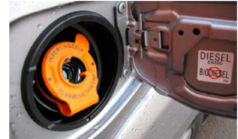
98 Väärän polttoaineen tankkauksen estävä korkki.

Ääniavusteinen, 4 puskuriin asennettua sensoria