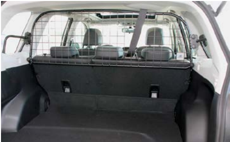
79 Kuormaverkko MIF555ESG100