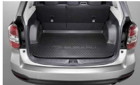
70 Tavaratilan suojamatto J515ESG000

Valaisee lattia-alueen sinisellä valolla. Mallivuodet MY16-