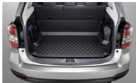
72 Tavaratilan suojamatto J515ESG100

Suojaa takaselkänojaa likaantumiselta. *Eryyisesti käytettäessä yhdessä tavaratilan suojamaton kanssa. Tarkista saatavuus jälleennyjältäsi.