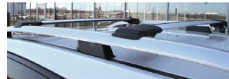
55 Taakkateline (kattokiskoilla)

Alumiini. Sopii automalliin, jossa on kattokiskot.