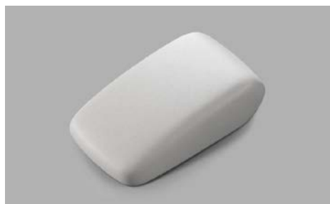
89 Käsinoja keskikonsoliin 92114SG050LL Harmaa, liukuva