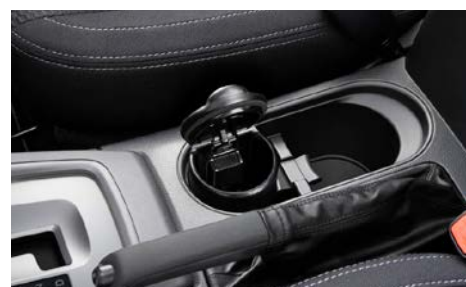
87 Tuhkakuppi F6010AG000 Sylinteri-muotoinen. Sopii mukinpidikkeisiin keskikonsolissa.