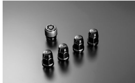
29 Lukkomutterisarja, Musta

16x6,5JJ offset 48. Anthracite. Hyvä talvivanne. (Ei Diesel tai XT.) Vanne saatavilla vain talvirengaspakettina.