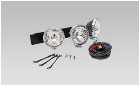
14 Ei saatavilla.