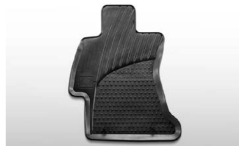
84 Kumimattosarja eteen J505ESG010