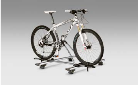
61 Pyöräteline, Basic E365ESG100

Yhdelle polkupyörälle, kiinnitty erikseen hankittavaan kattotelineeseen.