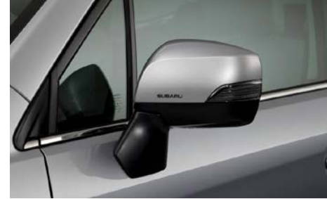
3 Peilinkalvo, hopea SEBDFJ3010 Hopea. Mallivuodet MY13-