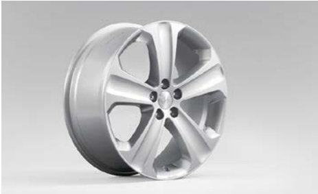
18 Alumiinivanne 18"