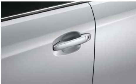
48 Ovikahvan suojakalvo SEZNF22000

Suojaa takapuskuria naarmuilta autoa lastatessa.