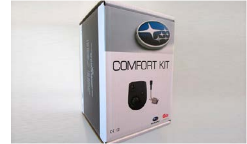
102 Calix mukavuuspaketti (dieselmoottorille) CX1620620

Lämmityssarja verkkovirralla, sisältää 1700w lämmittimen, lohkolämmittimen kytkentäsarjan ja verkkokaapelin.