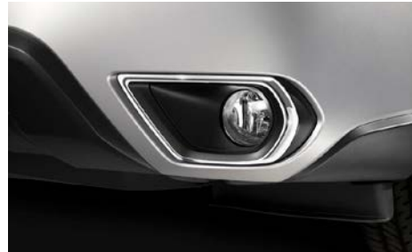
12 Sumuvalojen koristelista J105ESG000 Kromi. Vain MY13-15, Ei XT.