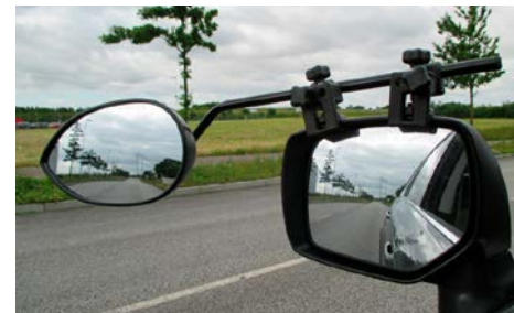
10 Asuntovaunupeilit (2kpl sarja) HF05100S Helposti kiinnitettävät aerodynaamiset asuntovaunupeilit. Kiinnitetään käteville kiinnikkeillä auton omiin peileihin. Peilit ovat pisanan muotoiset, mikä vähentää ilmanvastusta ja minimoii peilien tärinää. Peilin koko: 20,5x12,5 cm. Kuperia peilin lasi. Pitkät varret toimivat myös leveiden asuntovaunujen kanssa. Toimitetaan kätevässä säilytyslaukussa. Sarja sisältää kaksi peiliä.