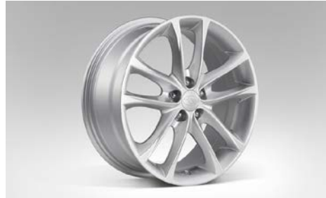
19 Alumiinivanne 17"

5-puolainen, hopea. 18x7,5JJ offset 48. Keski- kuppi tilattava erikseen SECWYA4000.