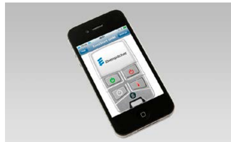
108 Telestart - Mobiilikäynnistys 29 2490 00 0145

Easystart R+ kaukosäädinohjain Eberspächer.