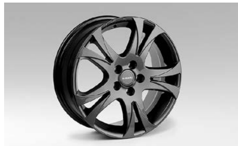
23 Alumiinivanne 17"