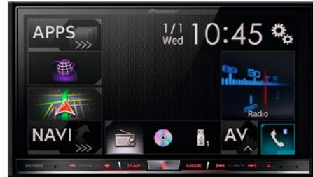
91 Pioneer audionavigaattori S560369-XV12

Vain MY18 malleihin joissa alkuperäisenä DAB radio.