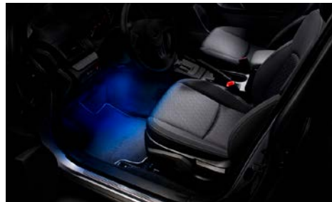
69 Sisävalaistussarja sininen H701SFJ001

Valaisee lattia-alueen sinisellä valolla. Mallivuodet MY16-