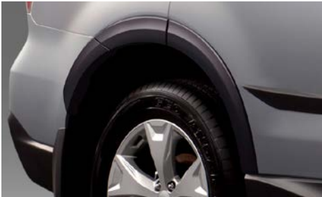
5 Lokasuojan levikkeet E2010SG020 Mallivuodet 13-15 vain XT. Mallivuosi 16 - 18, kaikki mallit.